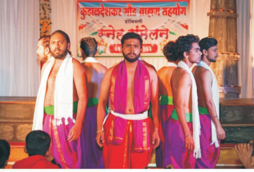
'अनय' नाटकाचा प्रयोग