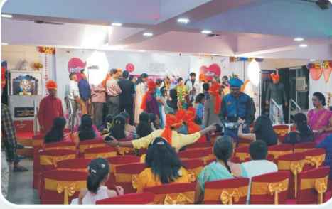
कै. अण्णासाहेब माईणकर सभागृह (वातानुकूलित)