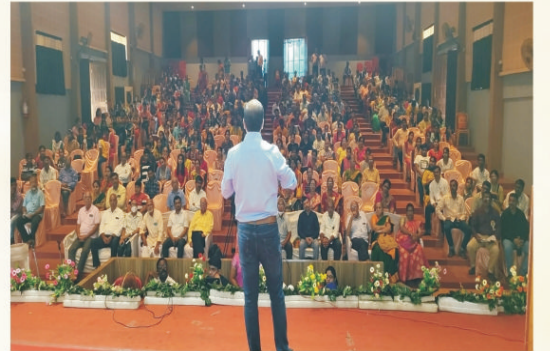
प्रेरणा परिषद - कुडाळ