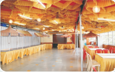
कै. इंदिराबाई सहदेव माईणकर सभागृह - भोजनकक्ष