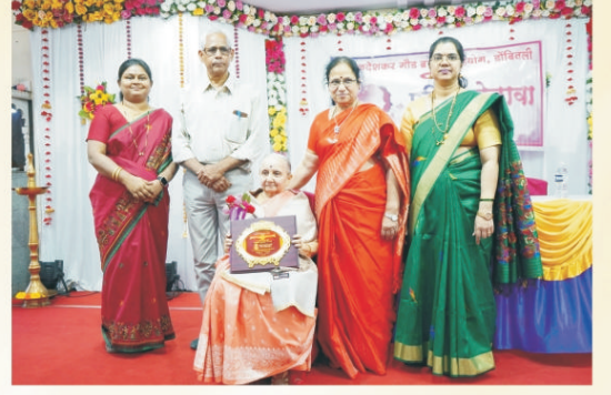
ज्योतीताई पाटकर स्मृती सेवाम्रती पुरस्कार २०२३