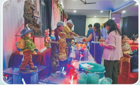
सुग्रास भोजनाची उत्तम सोय