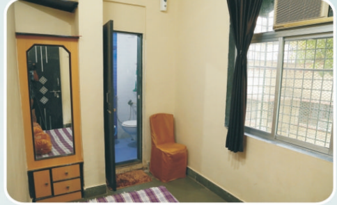
वधु-वरांसाठी सर्व सोर्यीयुक्त वातानुकूलित रुम्स