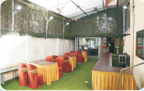
कुडाळदेशकर भवनाच्या आवारातील लॉन्स