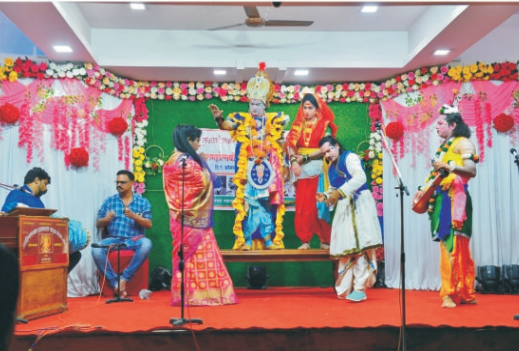
'रुद्रासूर मालिनी' नाटकाचा प्रयोग